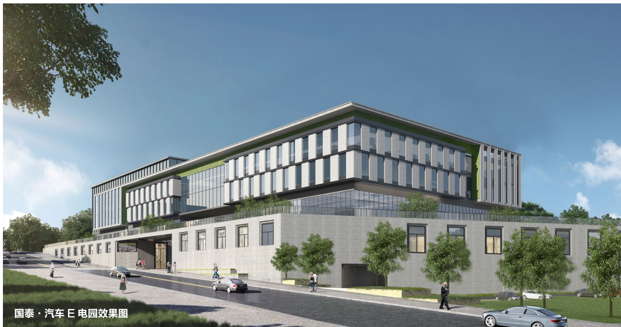
国泰·汽车E电园效果图